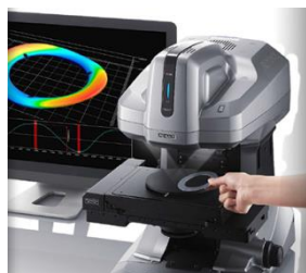
求められるコスト・スピードに応じた評価方法もご提案致します。是非ご相談下さい。